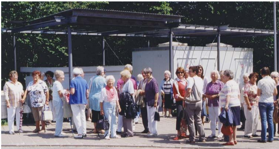
Warten auf den Bus zum Brombachsee