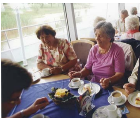
Unterhaltung und gemütliches Kaffetrinken auf dem Schiff und Spaziergang entlang der Reling mit Ausblick auf den See